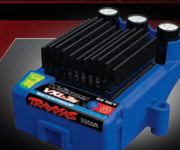
Velineon® VXL-3s Electronic Speed Control