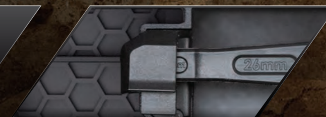
Adjustable Clipless Battery Hold Down