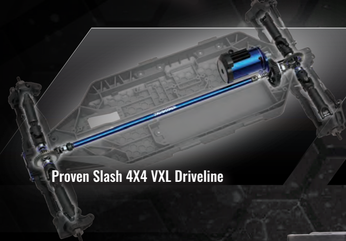
Proven Slash 4x4 VXL Driveline

Traxxas Pro Scale design merges scale realism with Extreme Velineon Brushless horsepower, durability, and 60+mph speed