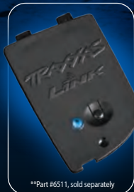
**Part #6511, sold separately