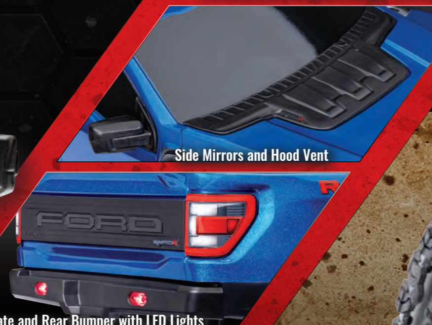
Side Mirrors and Hood Vent

Slash 4x4 VXL Chassis 12.8" Wheelbase (324mm)