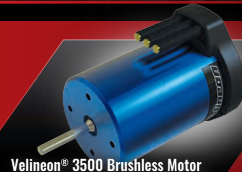
Velineon® 3500 Brushless Motor