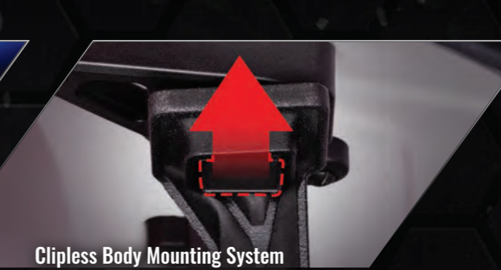
Clipless Body Mounting System