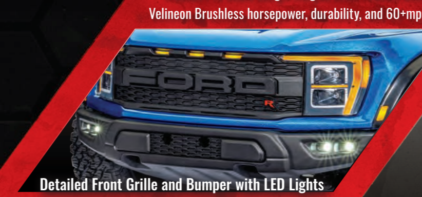
Detailed Front Grille and Bumper with LED Lights