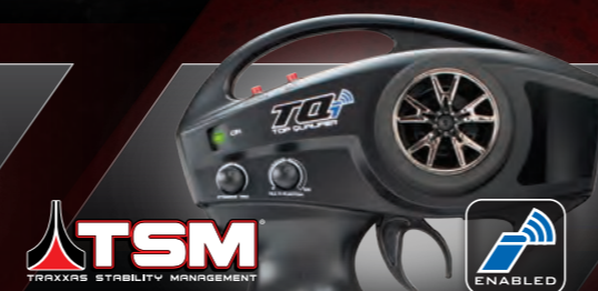
TQi™ 2.4GHz Radio System with TSM®