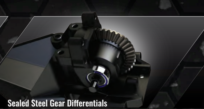
Sealed Steel Gear Differentials