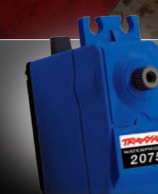
Waterproof Digital High-Torque Steering Servo